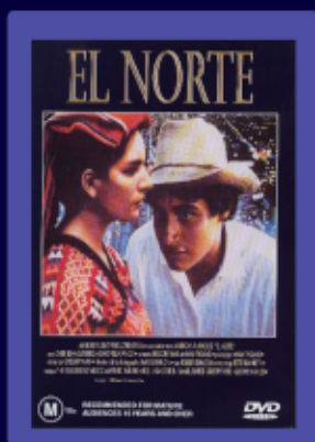
EL NORTE (1983) DE GREGORY NAVA